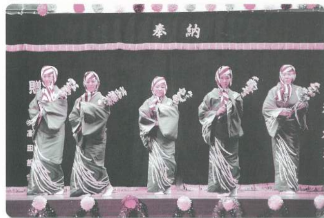
11: 浜原隣保館 舞踊教室【舞踊】