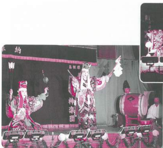
25: 都神楽団【石見神楽】