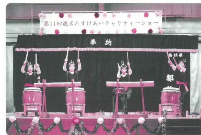
15: 和太鼓 はあ〜もにい〜【和太鼓】