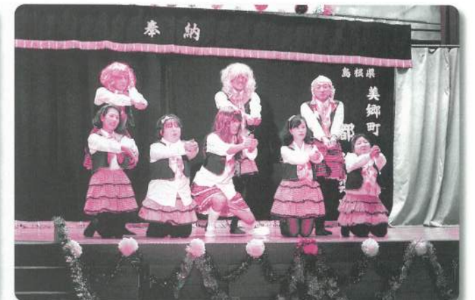
4：HJK8比叡自治会【ダンス】