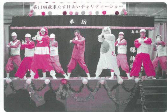
12: 美郷町建設業協会 青年部会【寸劇】