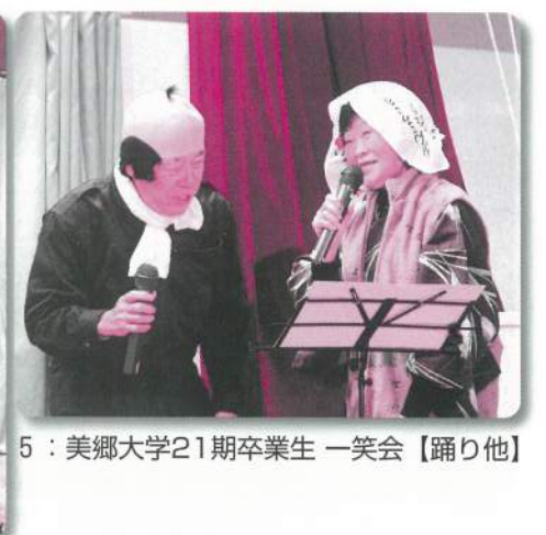
5：美郷大学21期卒業生 一笑会【踊り他】