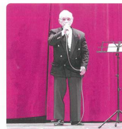
17: 比之宮カラオケ教室【カラオケ】