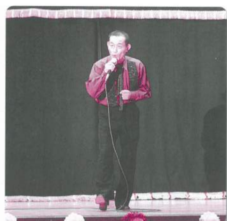
20: 艶歌工房【カラオケ】