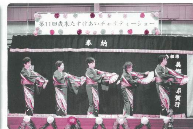
16: 比之宮舞踊教室【舞踊】