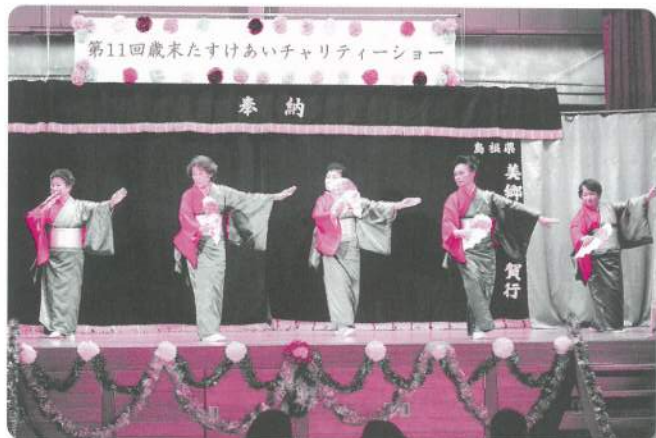
23: 都賀公民館 舞踊教室昼夜部【舞踊】