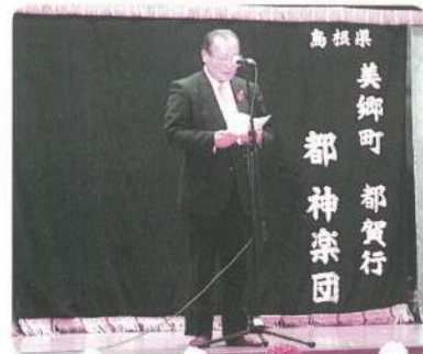
美郷町長あいさつ（共同募金委員会顧問）