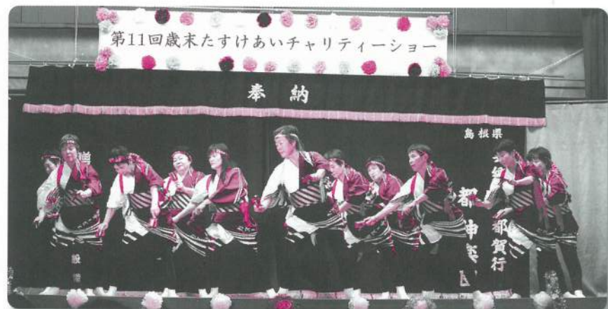
19: カヌー音頭保存会【踊り】