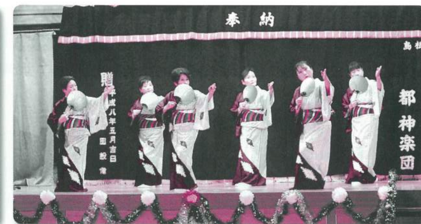
14: かすみ草の会【舞踊】