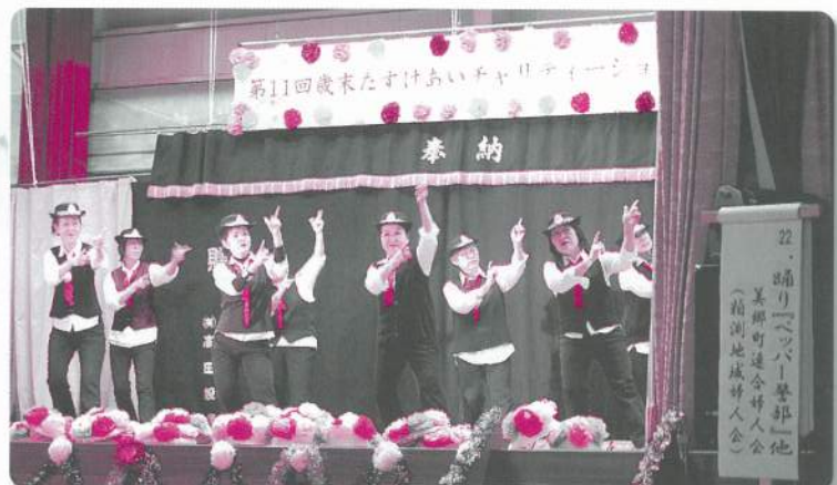
22: 美郷町連合婦人会(粕淵地域婦人会)【踊り】