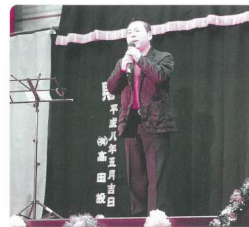
13: 都賀行隣保館 カラオケ教室【カラオケ】