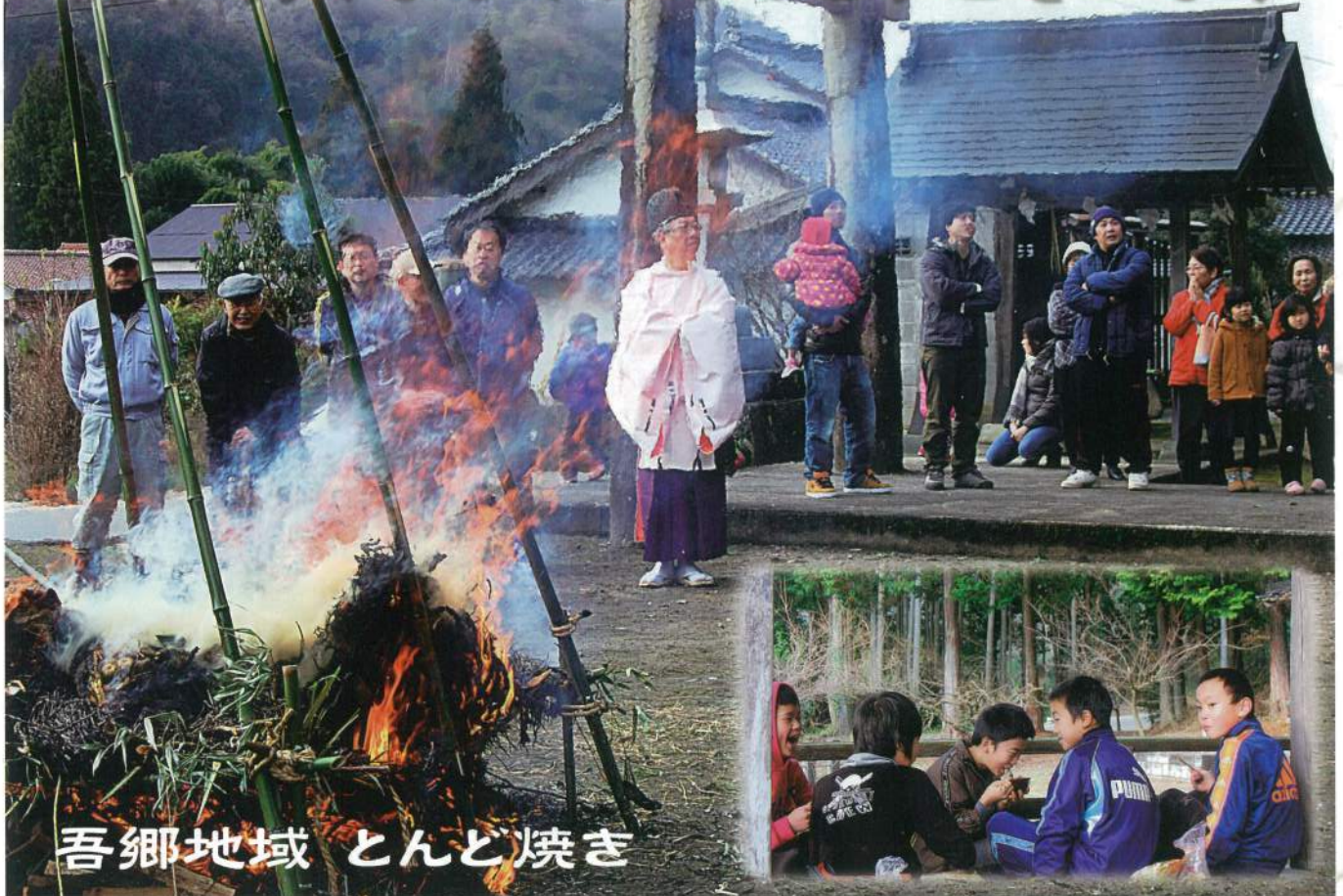
吾郷地域 とんど焼き