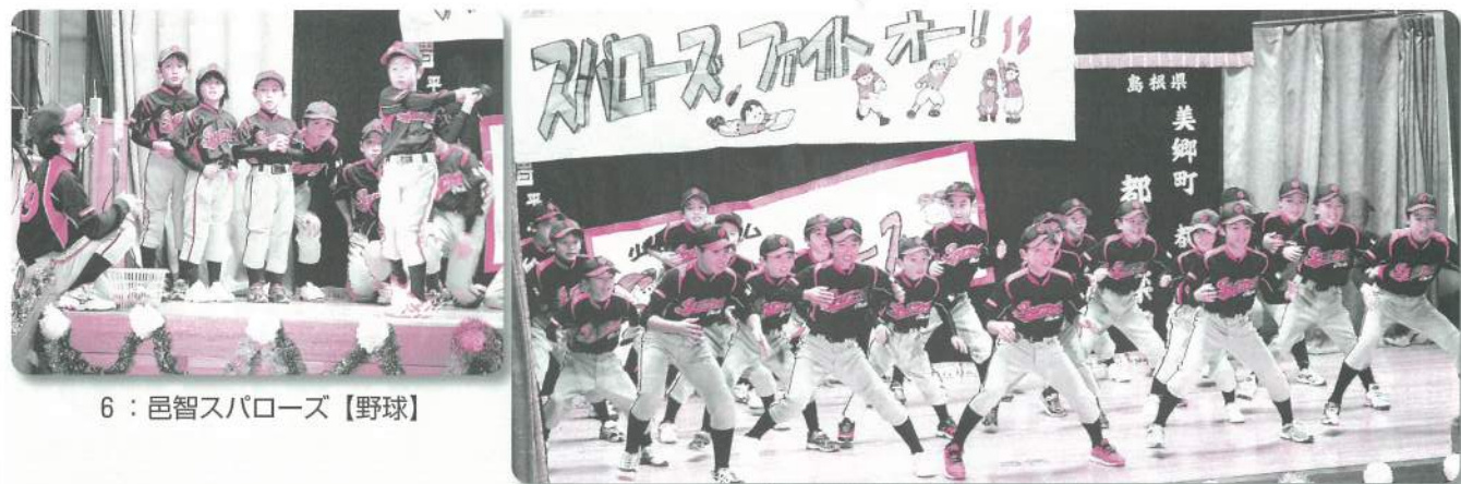
6: 邑智スパローズ【野球】