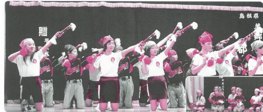
1：邑智小学校5年生【銭太鼓】