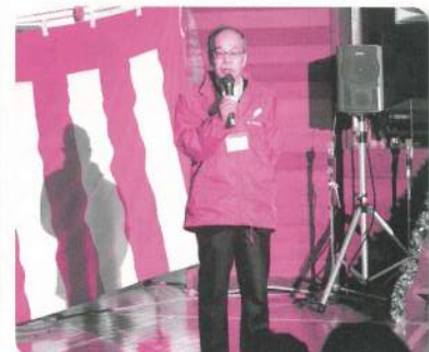
美郷町共同募金委員会会長あいさつ