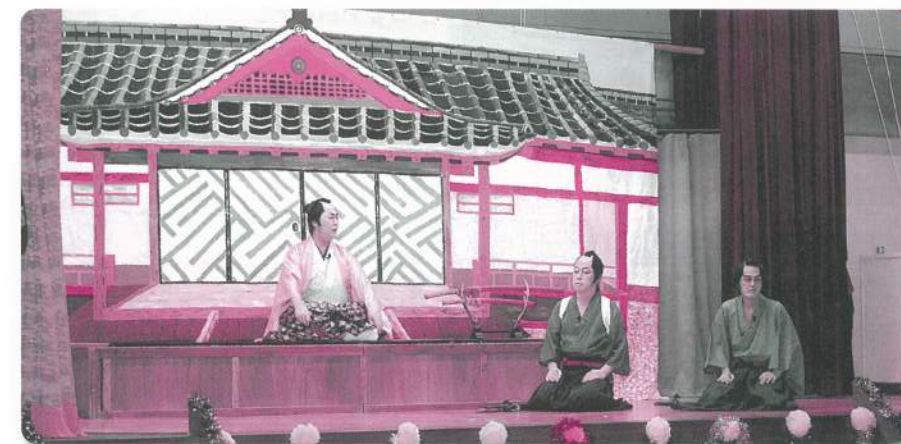
18: 吾郷青吾会【地芝居】