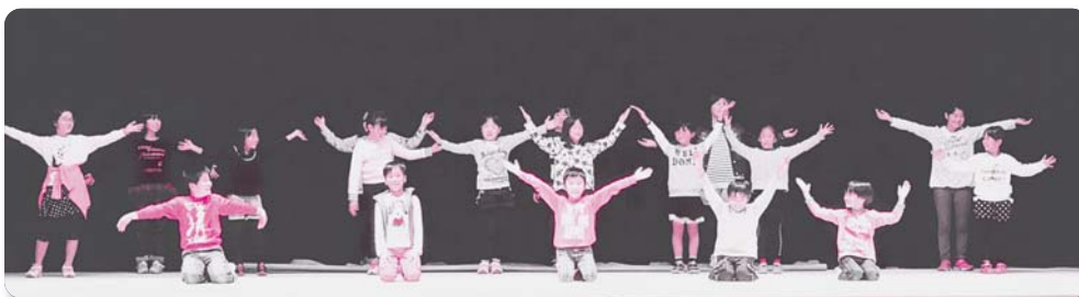
みさとの宝 今、輝け！