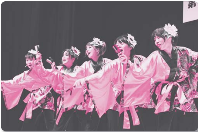
7：太陽花～しゅうてんか～【踊り】