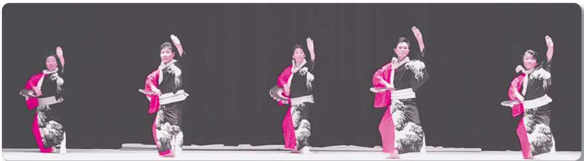
22: 都賀公民館舞踊教室【舞踊】