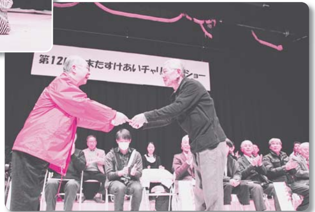
自治会対抗クイズ大会