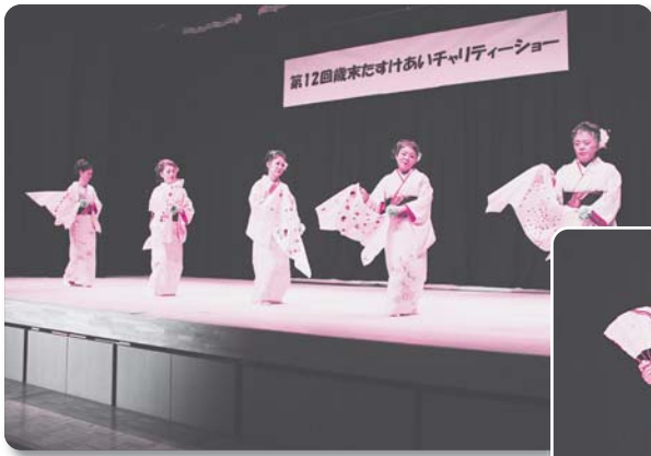
14：浜原隣保館舞踊教室【舞踊】