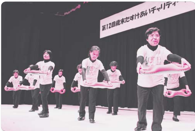
21: 美郷町老人クラブ連合会【3B体操】