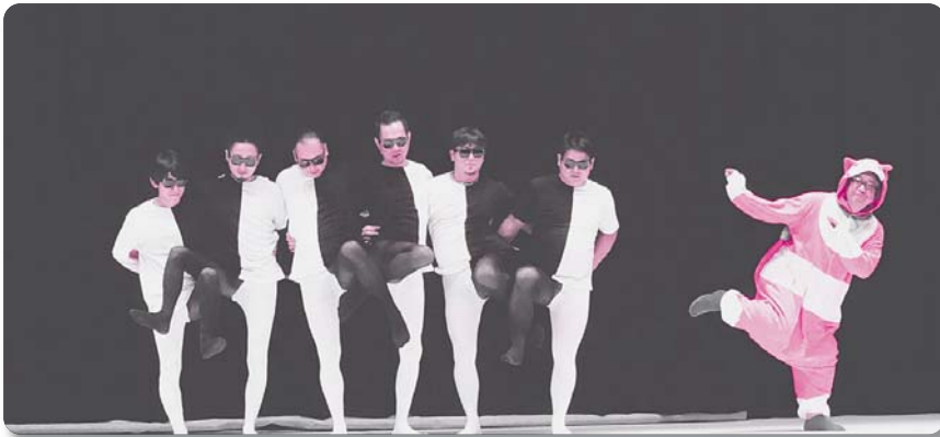
10：美郷町建設業協会【寸劇】