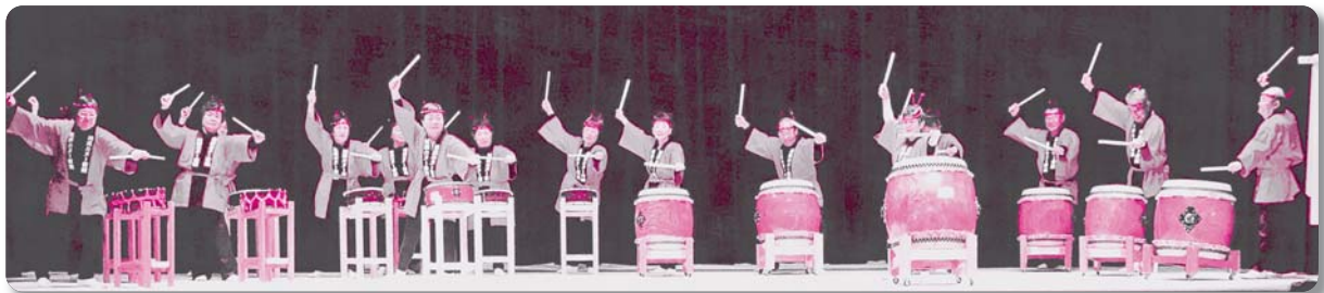
18：カヌー音頭保存会【和太鼓】