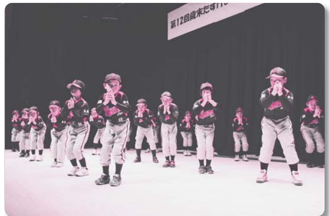
3 : 邑智スパローズ【野球】