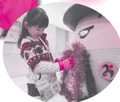
しまねっこ・みさ坊も募金に協力