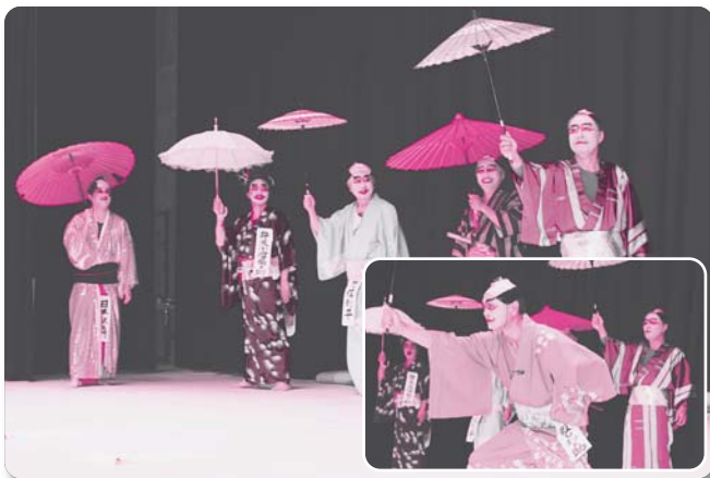
2 : 沢谷七人衆【寸劇】