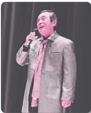
12：比之宮カラオケ教室 【カラオケ】