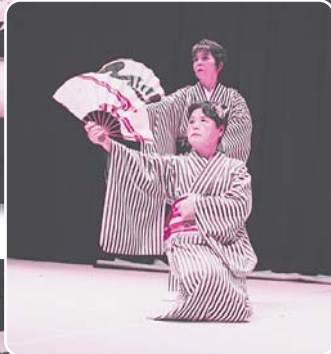
15：かすみ草の会【舞踊】