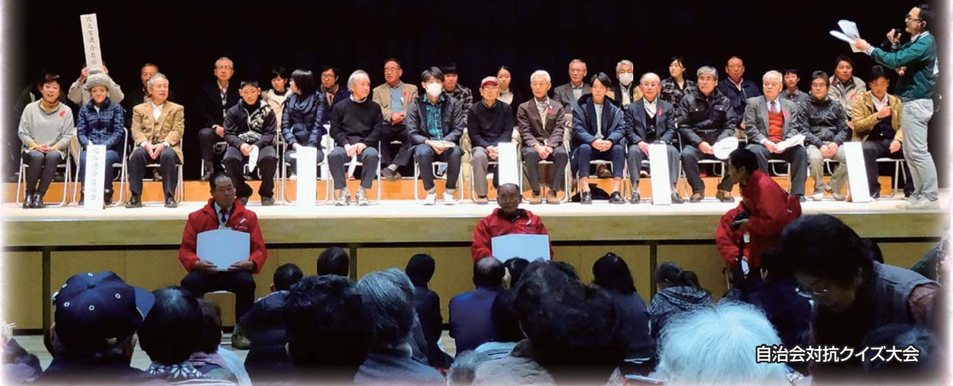
自治会対抗クイズ大会