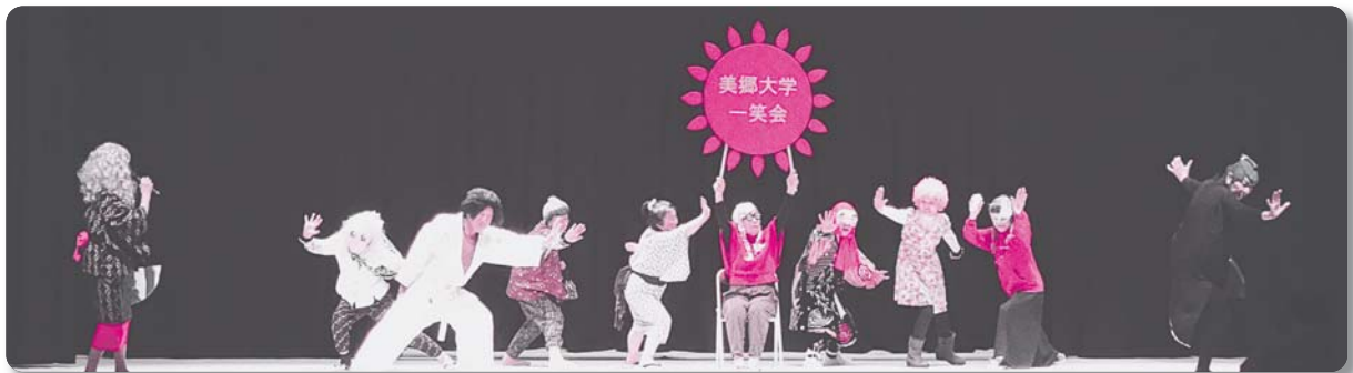
17：美郷大学21期卒業生一笑会【歌】