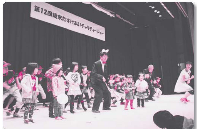
5 : 邑智大和ライオンズクラブ【踊り】