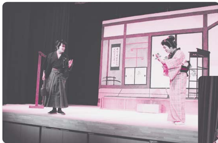
13：吾郷青吾会【地芝居】