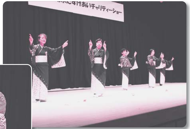
16：比之宮舞踊教室【舞踊】