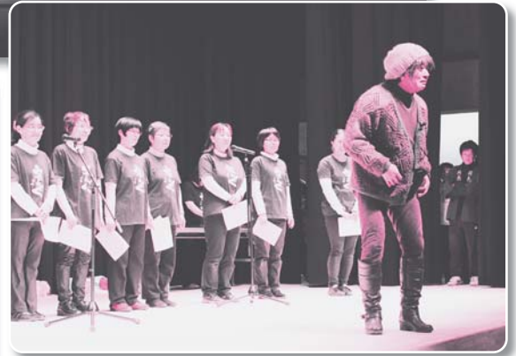
20: 美郷町連合婦人会吾郷地域婦人会【寸劇】