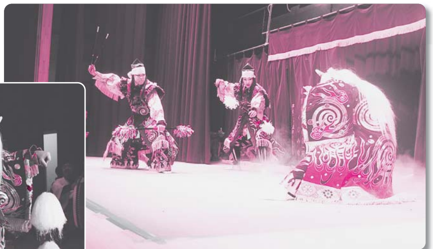
23: 地頭所神楽団【神楽】