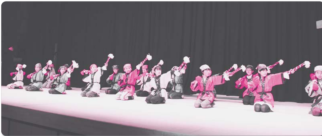
1 : 邑智小学校五年生【銭太鼓他】