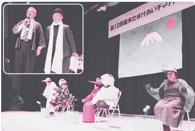
4 : 湯抱十五日会【踊り】