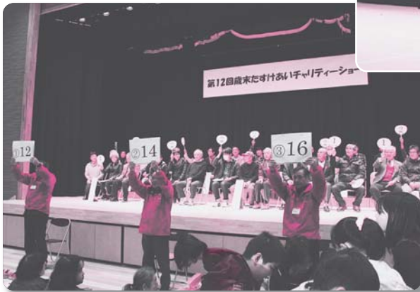
自治会対抗クイズ大会