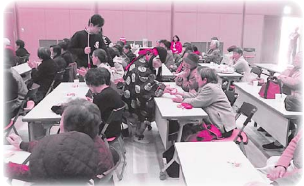
餅まきもありました!