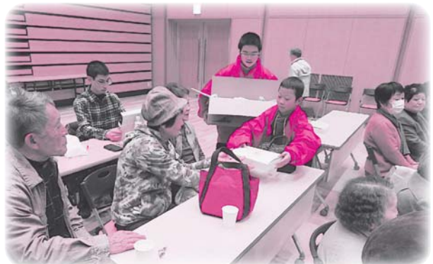
小中学生によるボランティアスタッフ