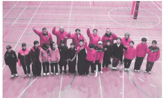
スポーツ少年団街頭募金 (令和元年12月18日)