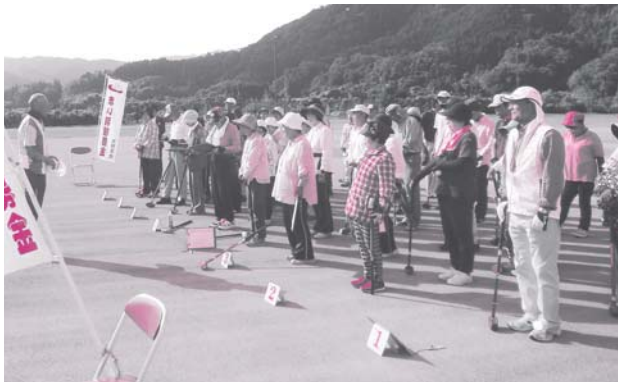
チャリティーグラウンドゴルフ大会 (令和元年9月18日)