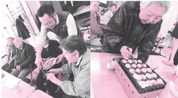
できたてのたこ焼きを食べました