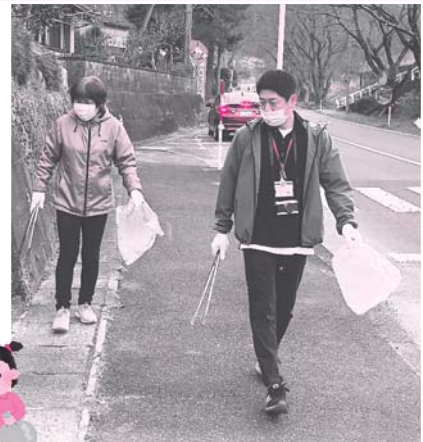
潮村の桜街道のごみ拾いをしました