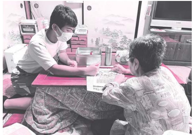
利用者さんとのお話は盛り上がっていました。