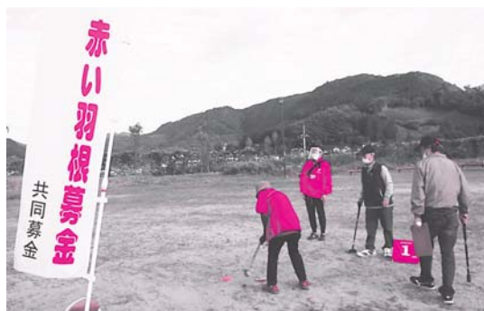
チャリティーグラウンドゴルフ大会 (令和2年10月7日)