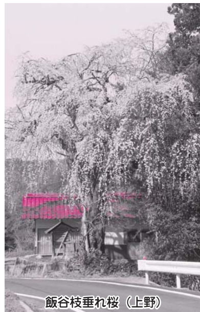
飯谷枝垂れ桜 (上野)

写真を募集しています! 美郷町内で撮影された写真を募集します。ご応募いただいた写真は『ころ』にて掲載させて頂きます。撮影対象や時代については問いません。皆さんの中の美郷町をお寄せください。