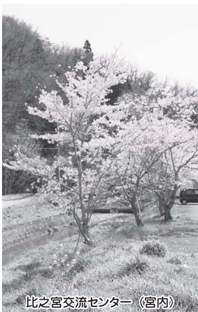
比之宮交流センター (宮内)