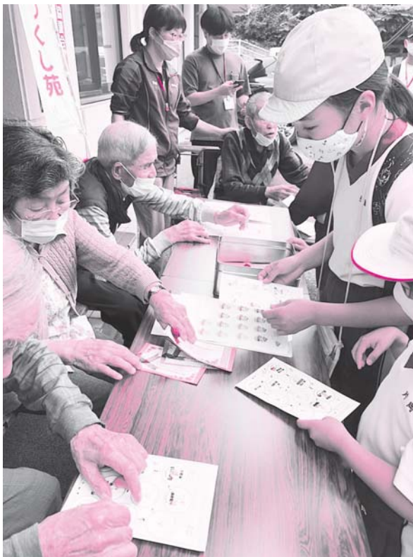
◀チェックポイント

〈大和小学校・全校遠足〉inつくし苑 お天気も良く、子どもたちとの交流楽しかったです♪