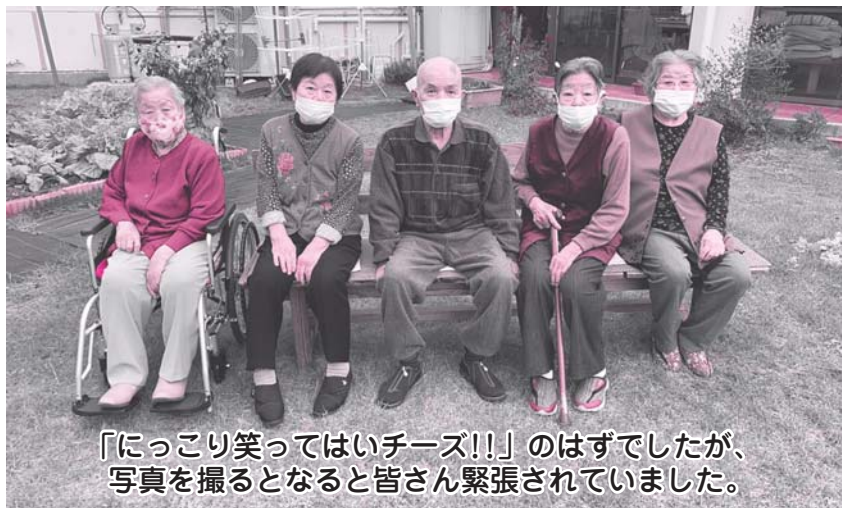
「にっこり笑ってはいチーズ!!」のはずでしたが、写真を撮るとなると皆さん緊張されていました。