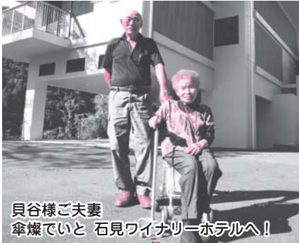
貝谷様ご夫妻 傘燦でいと 石見ワイナリーホテルへ!