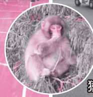
猿も見学に来ました!