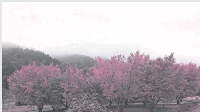
霧の中の銀杏 (都賀西)