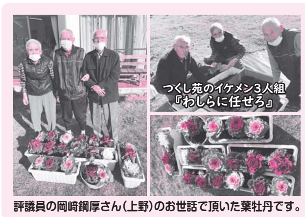
つくし苑のイケメン3人組 『わしらに任せろ』