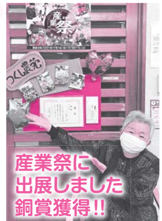
産業祭に 出展しました 銅賞獲得!!

大きな蕪や大根が出来 ました。つくし農園の野 菜は鮮度抜群。お昼ご飯 のお味噌汁に使用し、皆 さんに提供しました。