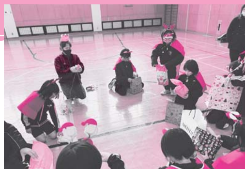
邑智クイーンジュニアスポーツ少年団