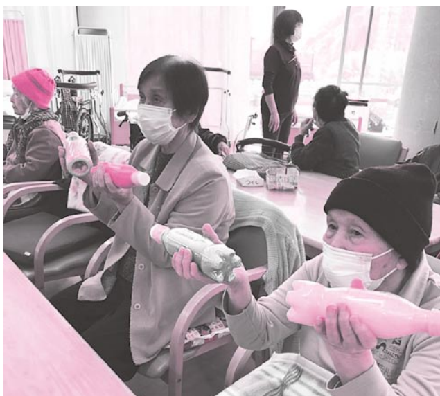
リハビリ ～100歳いきいき体操～ 手作りの重りで毎日元気にリハビリ♪