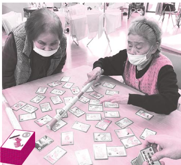
ことわざカルタ ～負けられない戦いがここにある～ わし(わたし)しか勝たん!!