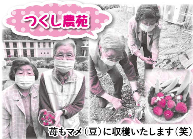
苺もマメ(豆)に収穫いたします(笑)