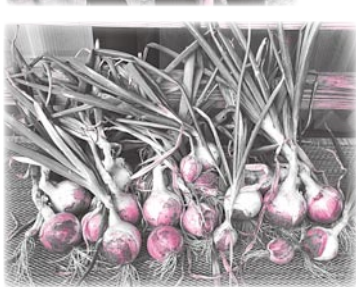
甘くておいしい新玉ねぎ♪ 大収穫でした!