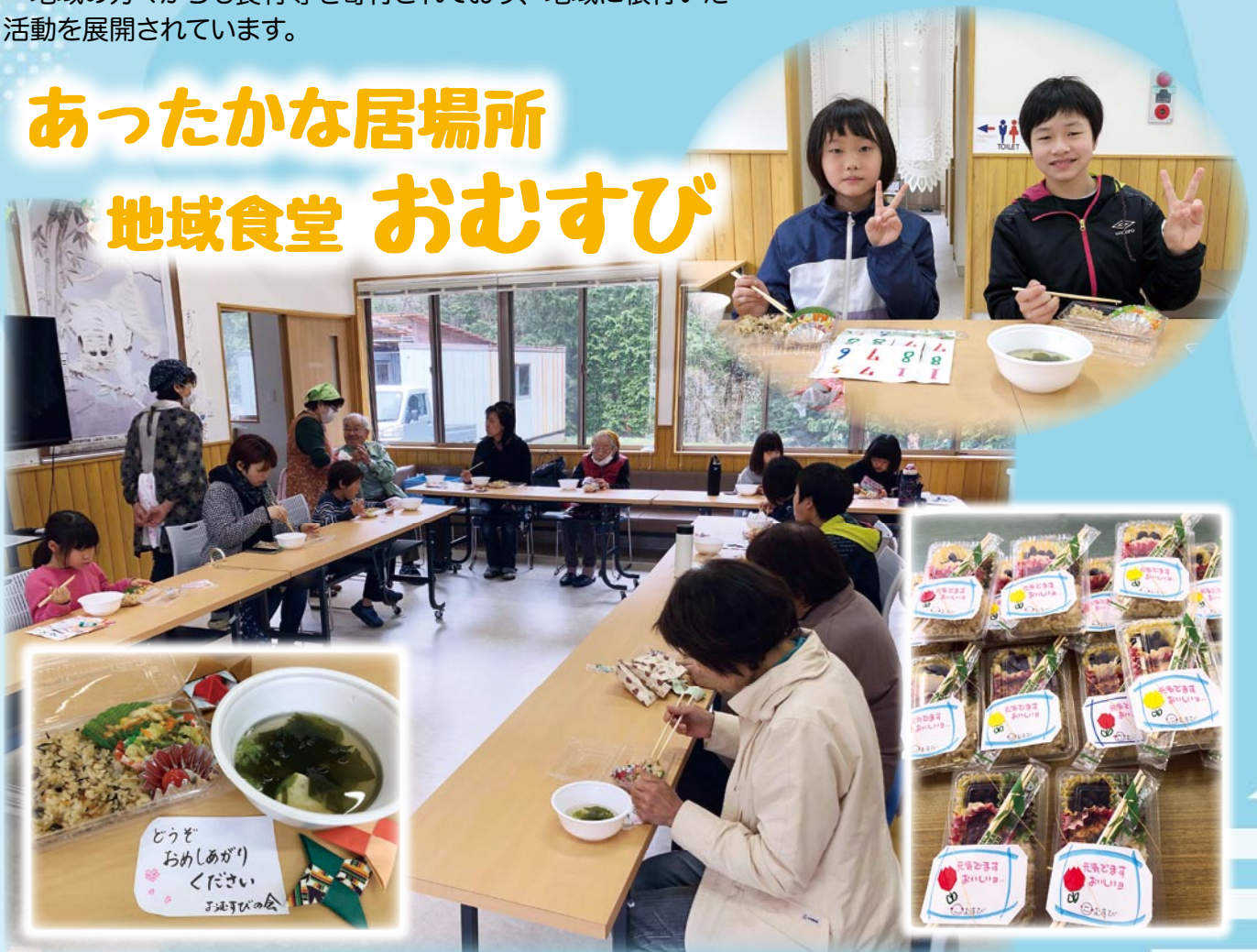
撮影地：悠花の郷（別府）