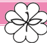
民生委員・児童委員のマーク

「民生委員」とは民生委員法に基づき社会福祉の増進のために、地域住民の立場から生活や福祉全般に関する相談・援助活動を行っています。全ての民生委員は児童福祉法によって「児童委員」も兼ねており、妊娠中や子育ての不安に関する相談や支援を行っています。