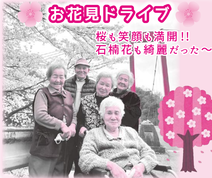
桜も笑顔も満開!! 石楠花も綺麗だった～