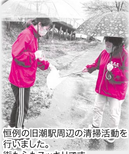
恒例の旧潮駅周辺の清掃活動を行いました。 街も心もスッキリです