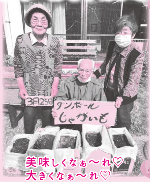
美味しくなあ～れ♡ 大きくなあ～れ♡