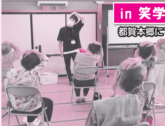
in 笑学館 都賀本郷にて出張体操!