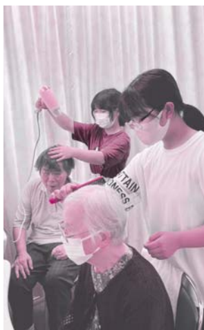
入浴後のヘアセット

小学校高学年～中学生を対象に「デイサービスセンターつくし苑」でのサマーボランティアを募集したところ、邑智小学校の児童3名が応募してくださいました。