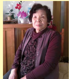
これからもお元気でお過ごしてください。

こうして元気にいることでひ孫にも会うことが出来、あっという間の成長を感じる楽しみが新たに増えました。