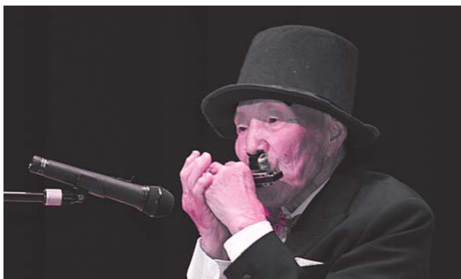
⑩ 美郷大学卒業生絆会