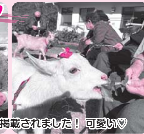
山陰中央新報に掲載されました！可愛い♡