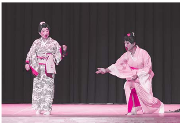
④ たかみ一座とゆかいな友達