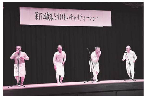
③ 邑智大和ライオンズクラブ