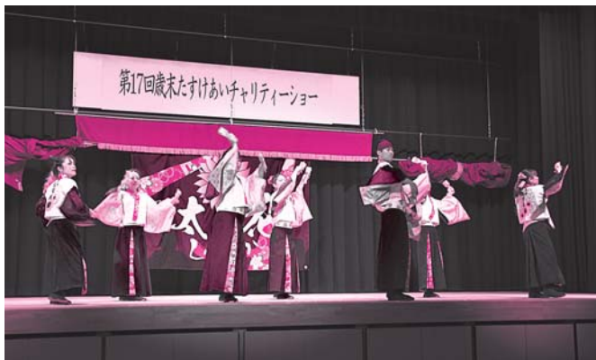
⑥ 美郷太陽花 ～しゅうてんか～