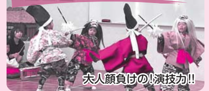
大人顔負けの演技力!!