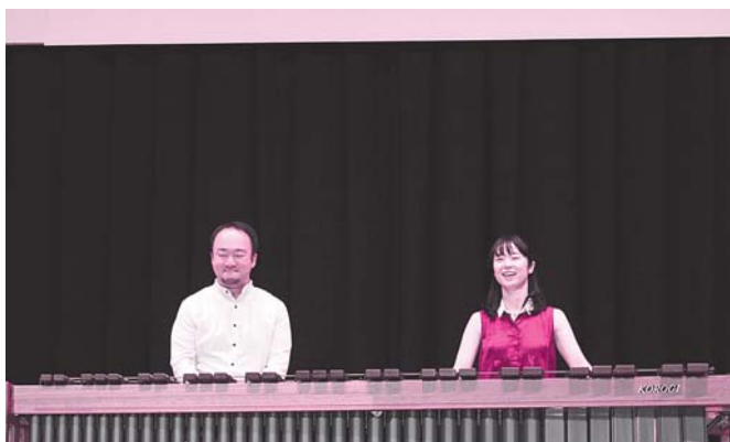
⑧ マリンバアンサンブルpoco