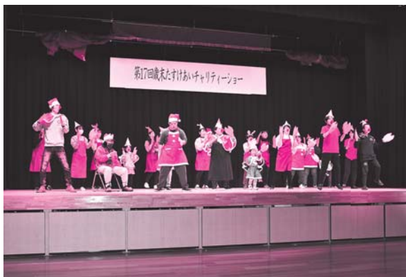
② わかば会ふれんず