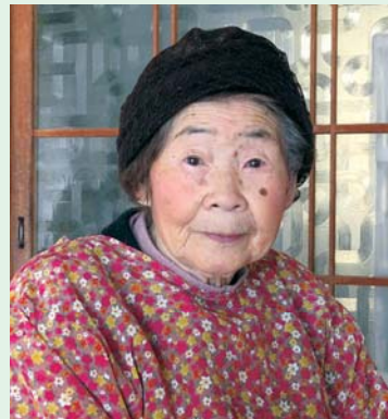
これからもお元気で お過ごしください。