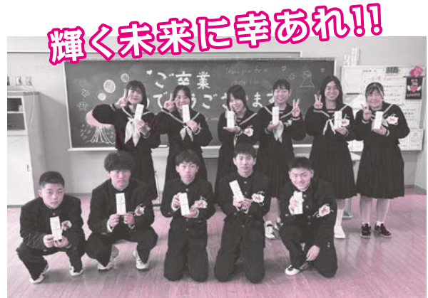
大和中学校卒業生